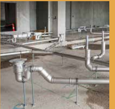
BLÜCHER® EuroPipe Цялостна тръбна канализационна push-fit система OD40-315 за окачена и вколпана канализация. Постига се най-висок клас на хигиена и минимална поддръжка.