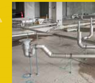
BLÜCHER® EuroPipe Цялостна тръбна канализационна push-fit система OD40-315 за окачена и вкопана канализация. Постига се най-висок клас на хигиена и минимална поддръжка.